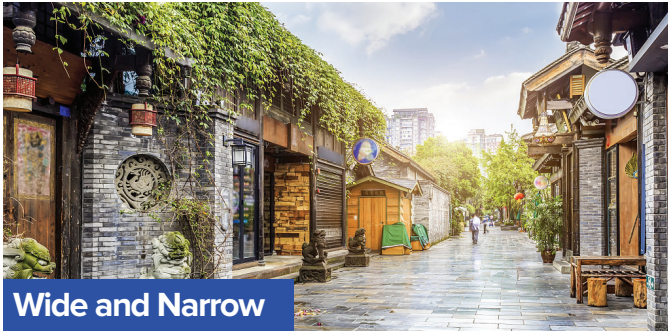
Wide and Narrow