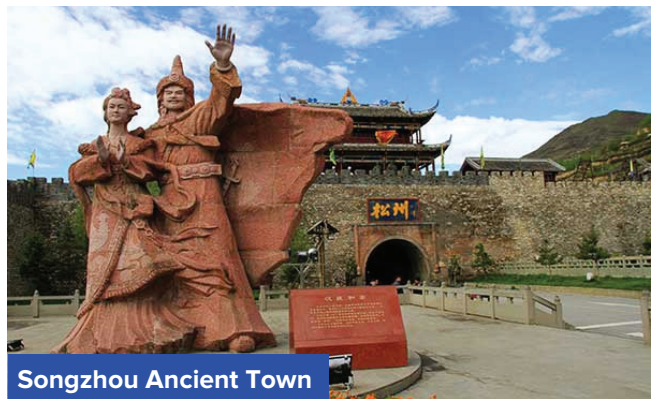
Songzhou Ancient Town