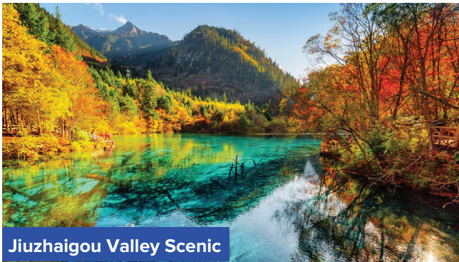
Jiuzhaigou Valley Scenic