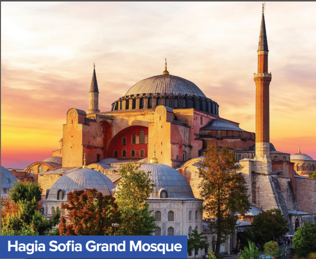
Hagia Sofia Grand Mosque