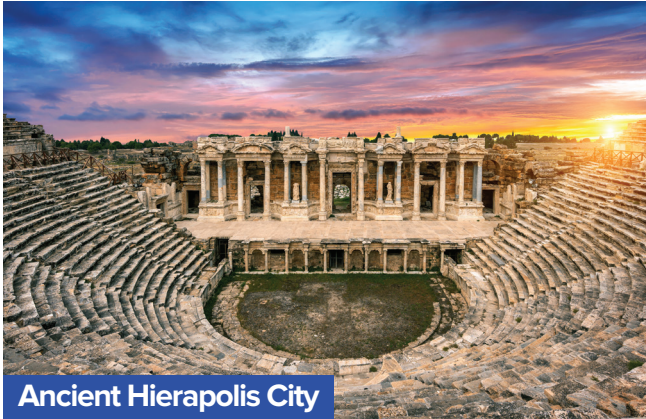
Ancient Hierapolis City