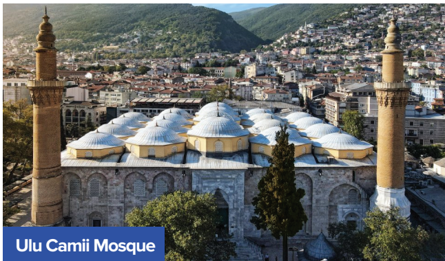
Ulu Camii Mosque