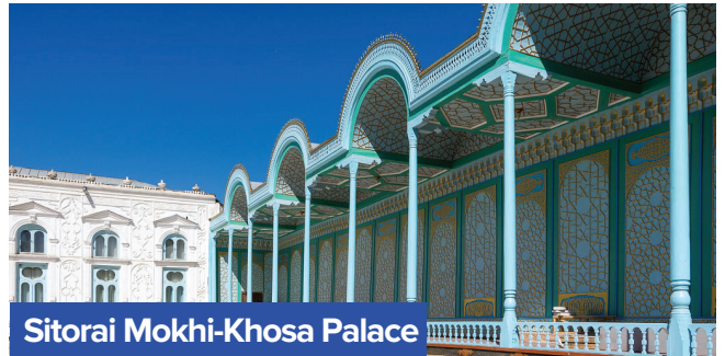
Sitorai Mokhi-Khosa Palace