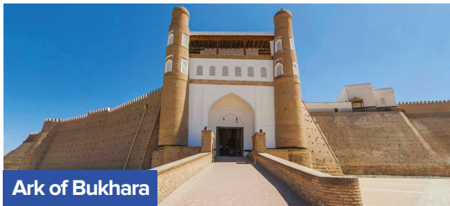
Ark of Bukhara