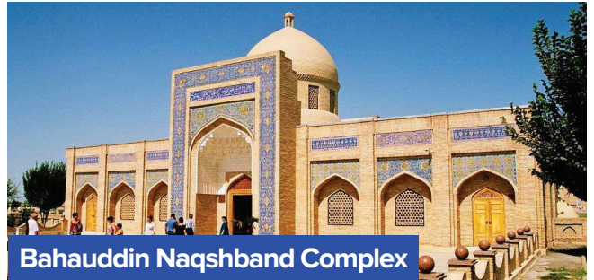
Bahauddin Naqshband Complex