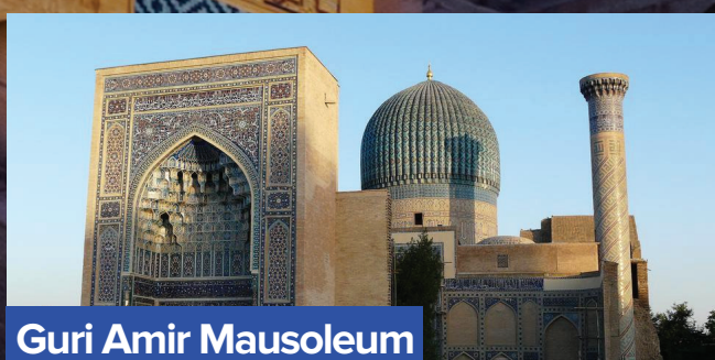
Guri Amir Mausoleum