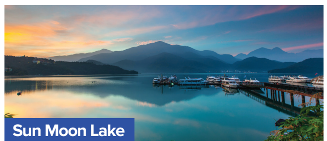
Sun Moon Lake