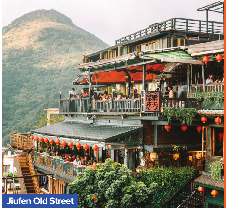
Jiufen Old Street