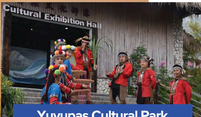
Yuyupas Cultural Park