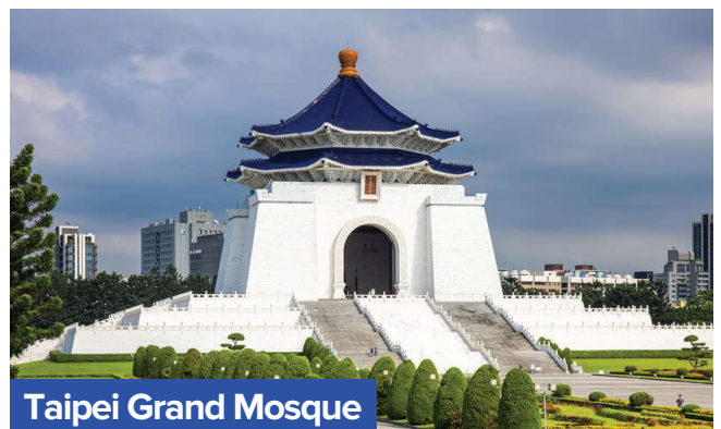
Taipei Grand Mosque