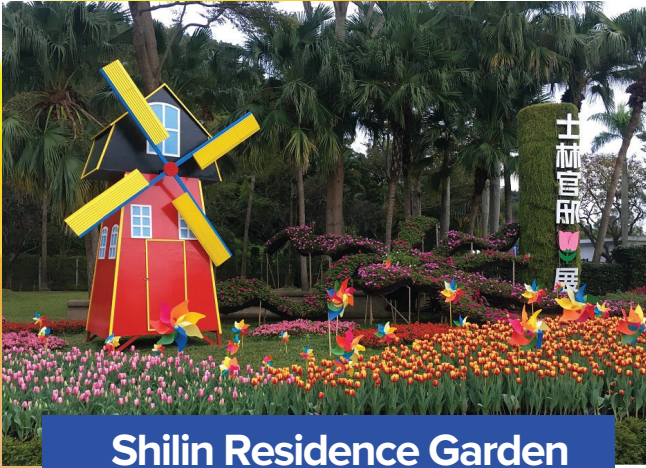
Shilin Residence Garden